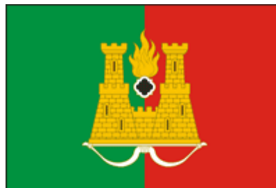
Флаг городского округа